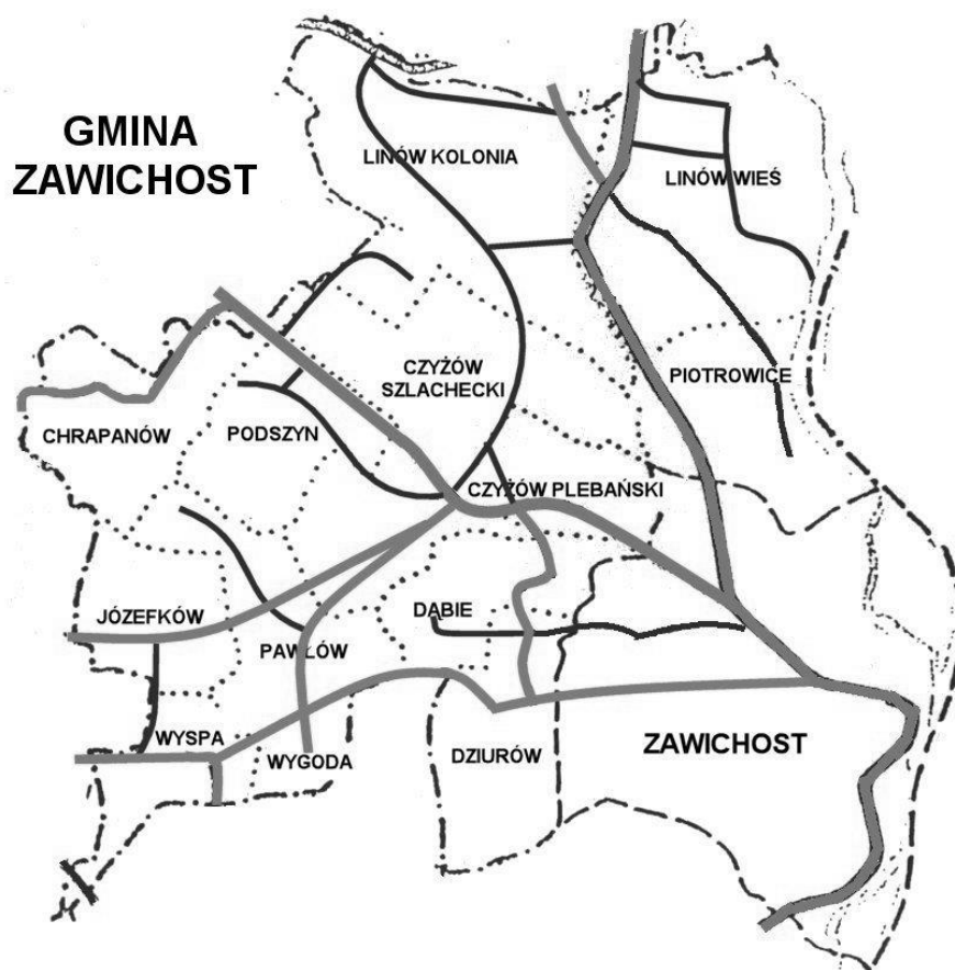
Rysunek 1. Położenie Gminy Zawichost

Gmina Zawichost położona jest w środkowowschodniej części Wyżyny Sandomierskiej, która jest częścią większej jednostki geograficznej o nazwie Wyżyna Kielecko-Sandomierska. Ogólna powierzchnia gminy w granicach administracyjnych wynosi 80,19 km 2 .